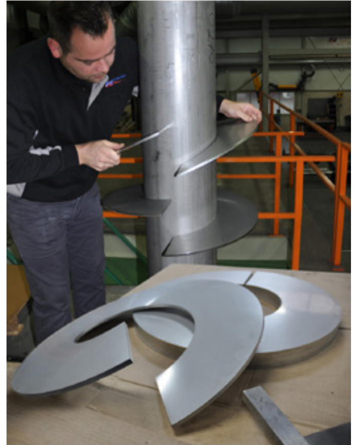
Van den Hout Schroefbladen fabriceert de schroefbladen in eigen beheer.

Het aanvragen van een offerte kan via de website www.schroefbladen.nl en gaat heel snel. In een eenvoudig invulformulier kan iedereen zijn gegevens invullen, samen met de gewenste maten in mm, aanvullende opmerkingen en een eventuele bijlage ter verduidelijking. Van den Hout Schroefbladen stuurt dan zo snel mogelijk een vrijblijvende offerte.